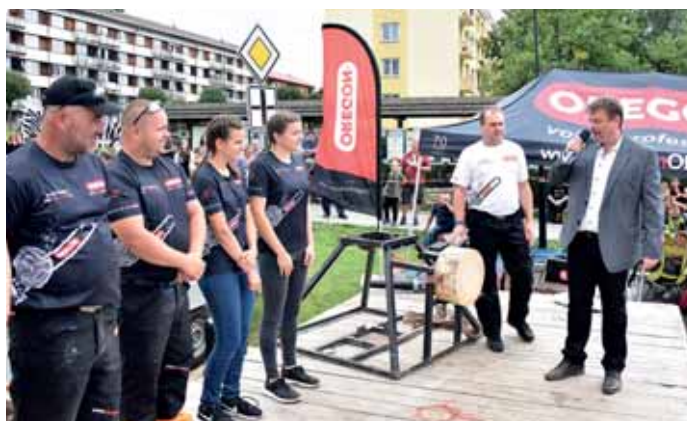
Eurojack je parta silných mužů a krásných žen.