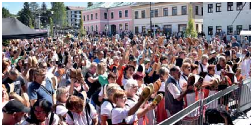
Tak za rok na stejném místě na shledanou.