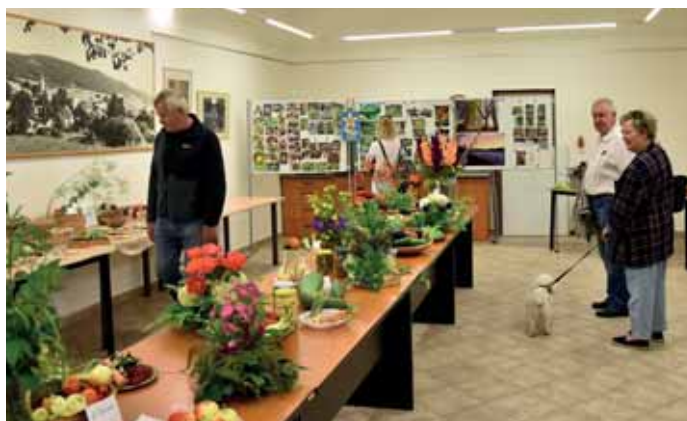
Zahrádkáři se usadili v přízemí radnice.