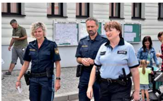
O bezpečnost se staral mezinárodní policejní tým.