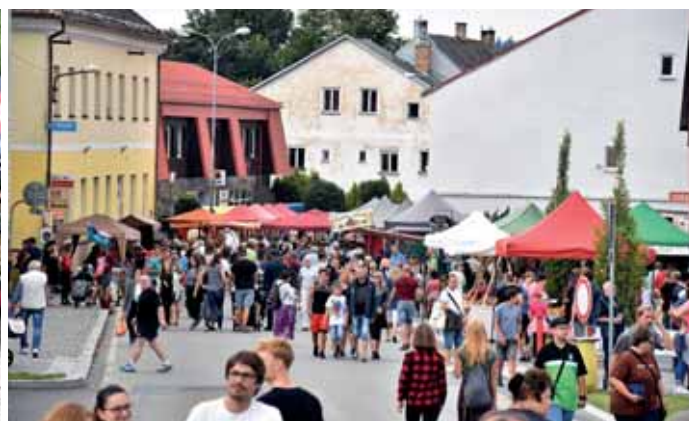
Stánků všeho druhu tu letos bylo na šedesát.