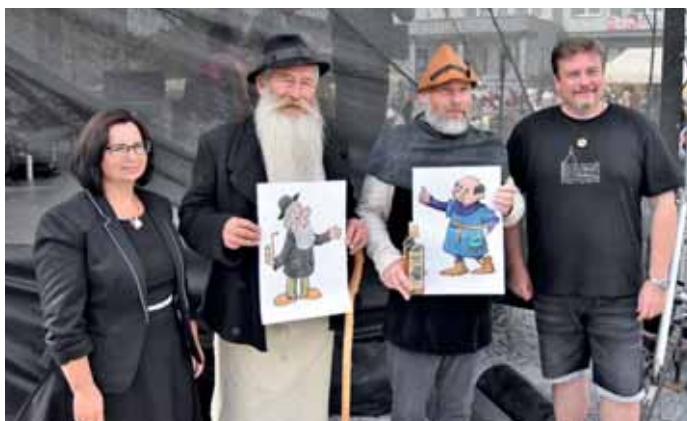
Volary znají nové maskoty – kresbičky Volarana a Ondřeje z Volar.