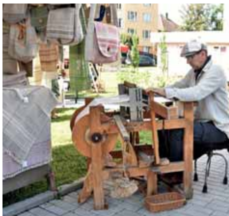
Tkalcovství patří k Šumavě stejně jako dřeváky.