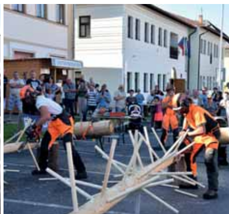
Kdo umí, ten umí.