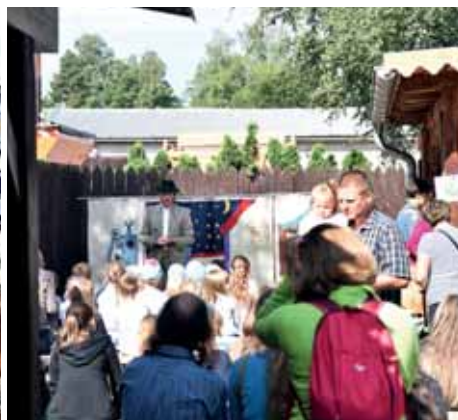
V muzeu se nejen pekly koláče, ale hlavně hrálo divadlo.