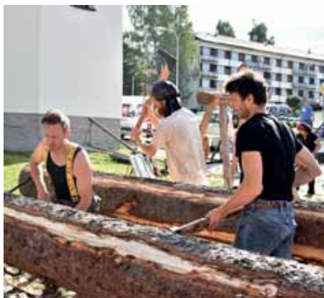
Slavnosti jsou zasvěceny dřevu a všem, kteří s ním umí zacházet.