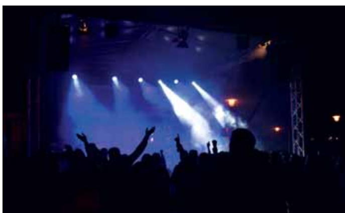
Sobotní večer patřil strakonickým Parkánům.