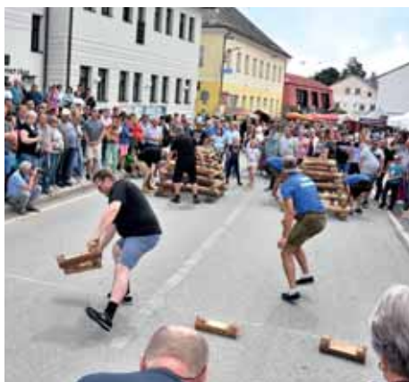
O putovní dřevák bojovaly čtyři týmy.