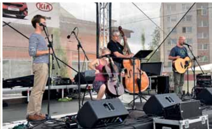
Skupina Bonsai č.3 přivezla do Volar folk...