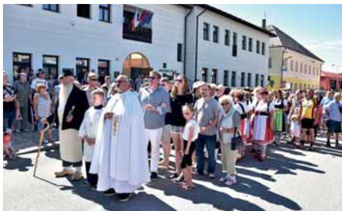
Bylo třeba trocha toho hecování, ale rekord nakonec padl.