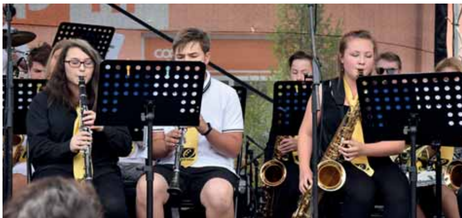
V pravé poledne aneb volarský V-Band.